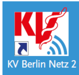
Symbol neues Programm

Das Update auf KV Berlin Netz 2 können Sie von unserer Webseite herunterladen: www.kvberlin.de > Für die Praxis > Service > Online-Dienste