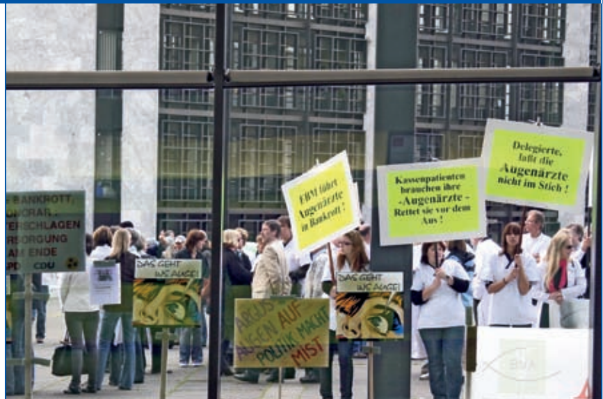
Proteste am Rande der Vertreterversammlung

sungsvorbehalte gesteuerter Kollektivtarif sowie ein Kollektivtarif auf Kosten-erstattungsbasis.