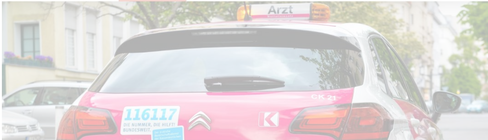
Fahrzeug des Ärztlichen Bereitschaftsdienstes.